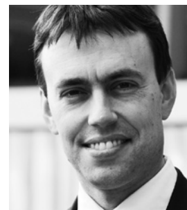
Dr. Nils Schmid MdL

Dr. Nils Schmid MdL , stellv. Ministerpräsident und Minister für Finanzen und Wirtschaft des Landes Baden-Württemberg